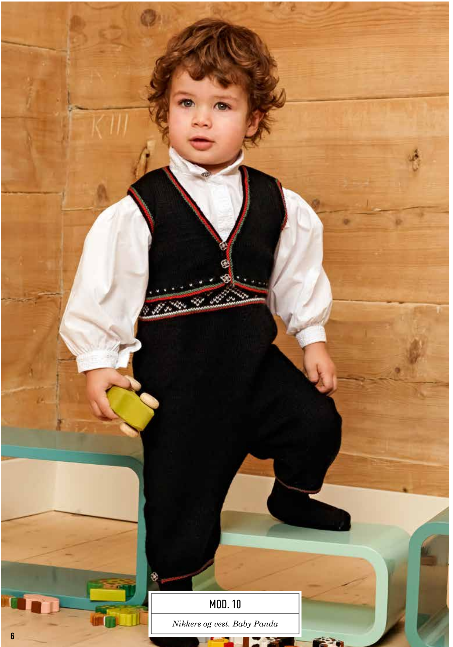
MOD. 10 Nickers og vest. Baby Panda