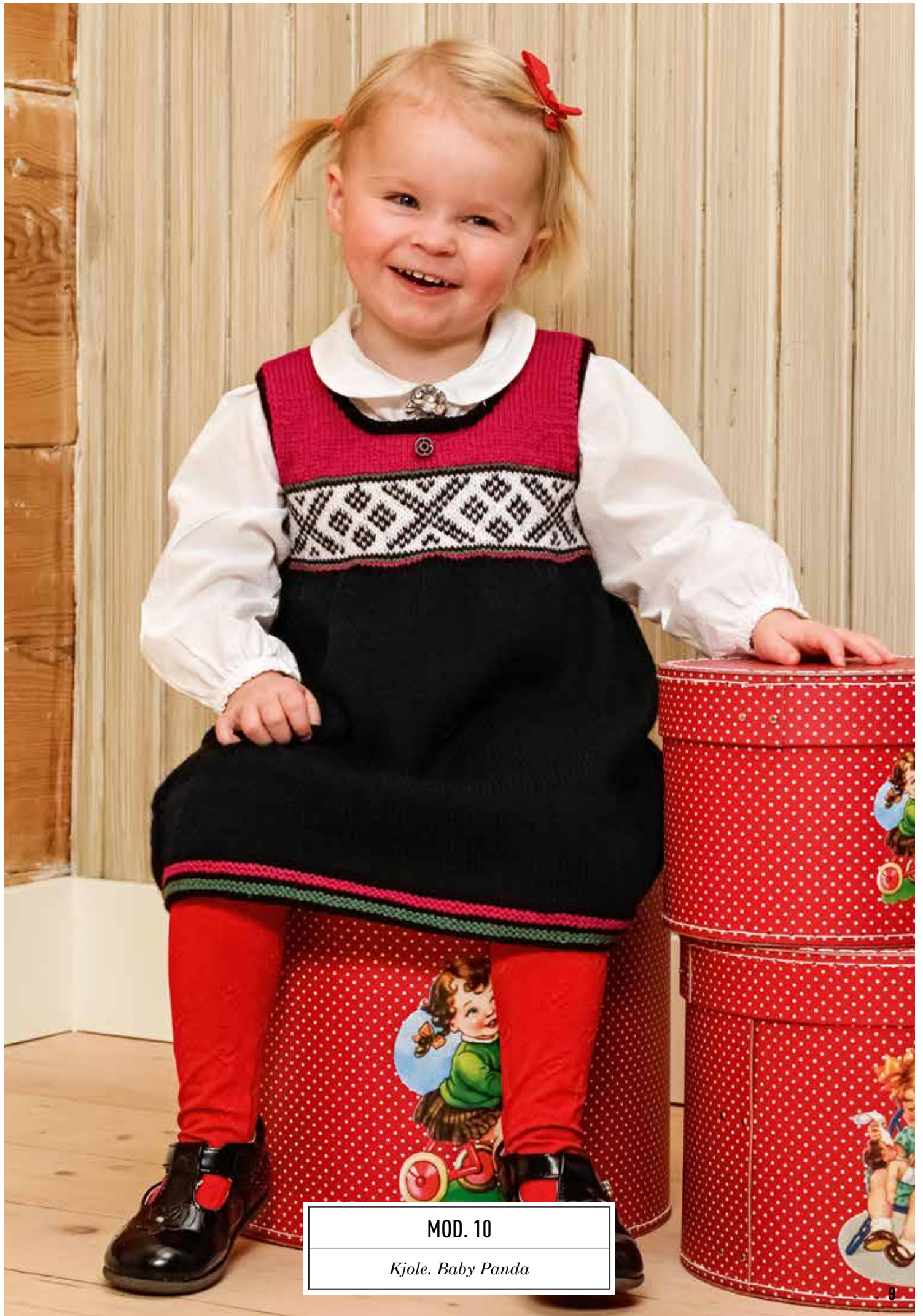
MOD. 10 Kjole. Baby Panda